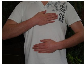
Herzbereich - Bauchbereich